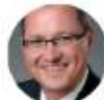
DATA PROTECTION COMMISSIONER OF HESSEN (GERMANY)