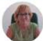
AUTORITÀ GARANTE ITALIANA