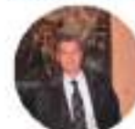
AUTORITÀ GARANTE PER LA PROTEZIONE DEI DATI (GRUCIA)