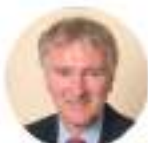
CAVANTE E RELATORE