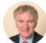
INFORMATION COMMISSIONER'S OFFICE (GRAN BRETAGNA)