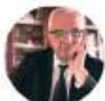
VICEPRESIDENTE ASSO DPO