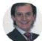
COORDINATORE COMITATO SCIENTIFICO E REFERENTE PER I SOGNI ASSO DPO