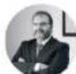
PRESENTE COMITATO SCIENTIFICO ASSO DPO