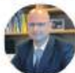
PRESIDENTE ASSO DPO