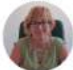
CAVANTE E RELATORE