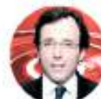
GIORNALISTA IL SOLE 24 ORE